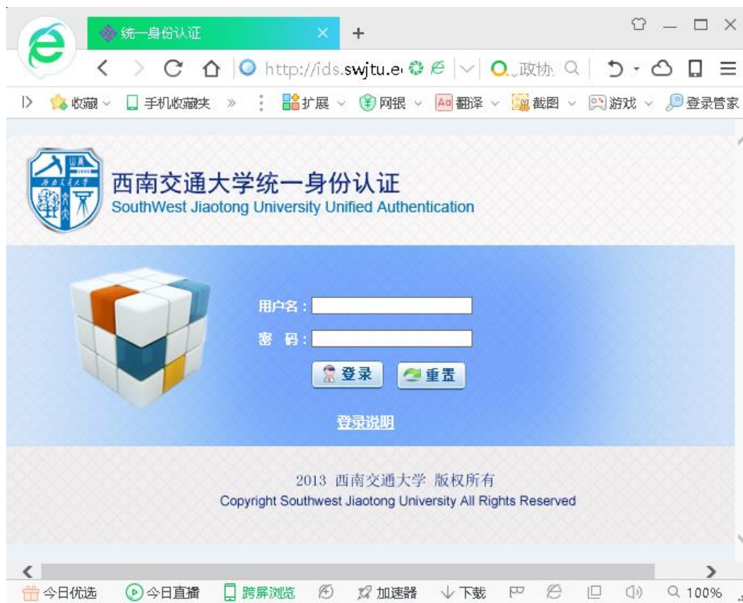
图 1 系统登录界面

登录网址： http://icp.swjtu.edu.cn ，登录界面见图 1。